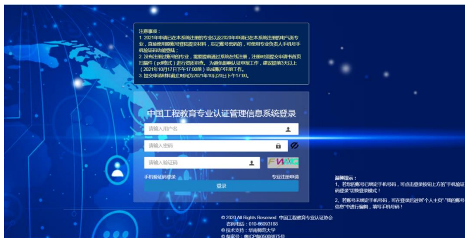
图 1 系统登录界面

请登录“工程教育专业认证管理信息系统” http://gcrz.ceeaa.org.cn/ （如图 1 所示）。