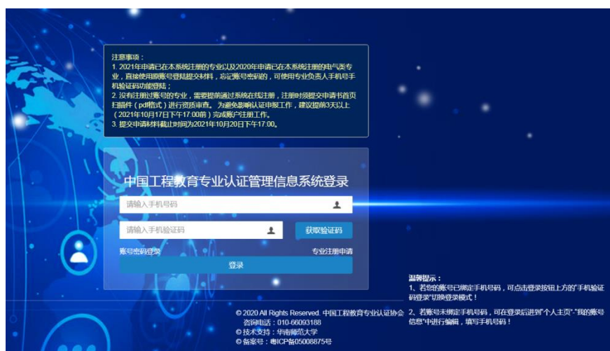
图 2“手机验证码登录”登录界面